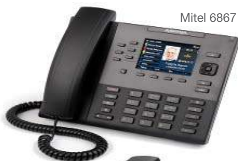
Mitel 6867 SIP Phone