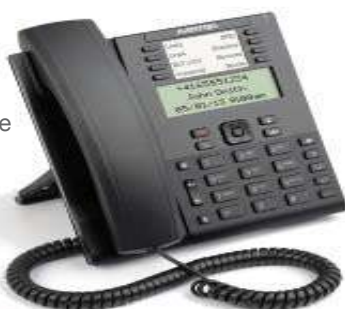
Mitel 6865 SIP Phone

Die Mitel 6800 Familie umfasst eine Reihe leistungsstarker SIP-basierter Telefone, die erweiterte Interoperabilität mit allen wichtigen IP-Telefonieplattformen bieten. Das moderne Industriedesign der Mitel 6800 SIP Phone eignet sich bestens für den Einsatz im Unternehmen.