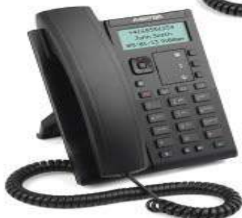
Mitel 6863 SIP Phone