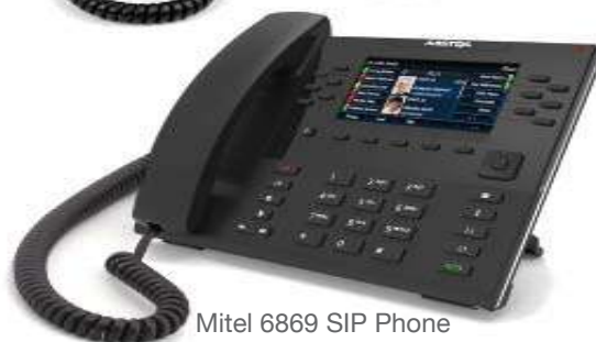
Mitel 6869 SIP Phone